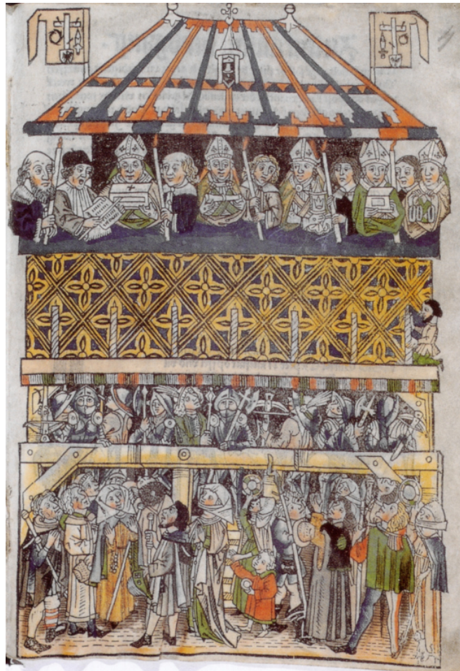
Ostension des reliques de Nuremberg à la Maison Schopperschen, 1487, gravure sur bois, Staatsarchiv de Nuremberg, Rst. Nürnberg Handschriften 399a.